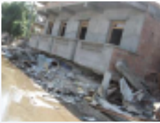
アルジェリア北部地震 (2003)