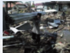
スマトラ島沖地震 (2004)