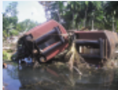
スマトラ島沖地震 (2004)