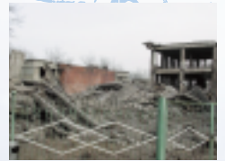
中国 唐山地震 (1976)